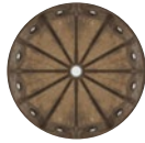
Sagrestia vecchia (cupola)