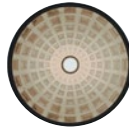
Sagrestia nuova (cupola)